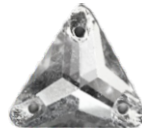
Triangolo 16 x 16 mm *