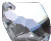
Rombo 16 x 21 mm