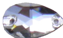
Goccia 17 x 28 mm *

* COLORI DISPONIBILI NELLE FORME CONTRASSEGNAE