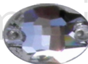
Ovale 17 x 24 mm