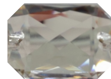
Ottagono 20 x 28 mm