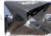
Rettangolo 18 x 25 mm