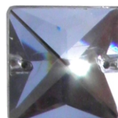
Quadro 22 x 22 mm

* COLORI DISPONIBILI NELLE FORME CONTRASSEGNAE